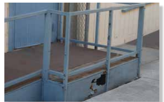
Madera con daños extensos de termitas necesita ser reemplazado