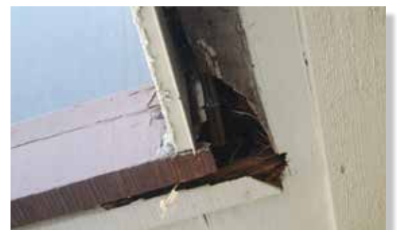
Techos deteriorados en escuelas locales están en necesidad de reparación